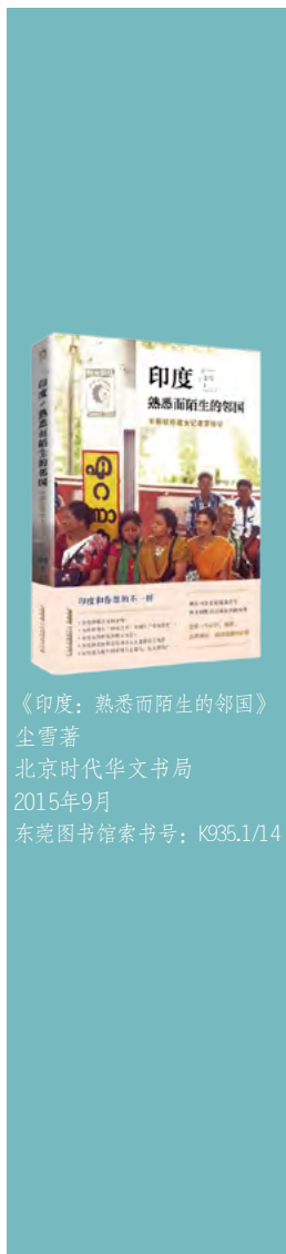
《印度：熟悉而陌生的邻国》 尘雪著 北京时代华文书局 2015年9月 东莞图书馆索书号：K935.1/14

中国驻印度女记者尘雪写的这部《印度：熟悉而陌生的邻国》，从书名上看，就知道它是带有揭秘性质的“印度认知书”。作者不像普通的旅行者那样，着重讲述旅行中的心情与美景；也不像文学家那般，发挥想象大肆创作。她是依托特殊的身份和工作需要，深入这个国家，走进当地人群之中，从最普通的民众讲到德高望重的权威人士。作者在感受印度文化、民俗民风的基础上，为中国读者呈现了一个真实而神奇的国家，一些不为我们所知的风土人情，一群最具代表性的人物。例如，为何印度女性频频受到侵害？为何印度人